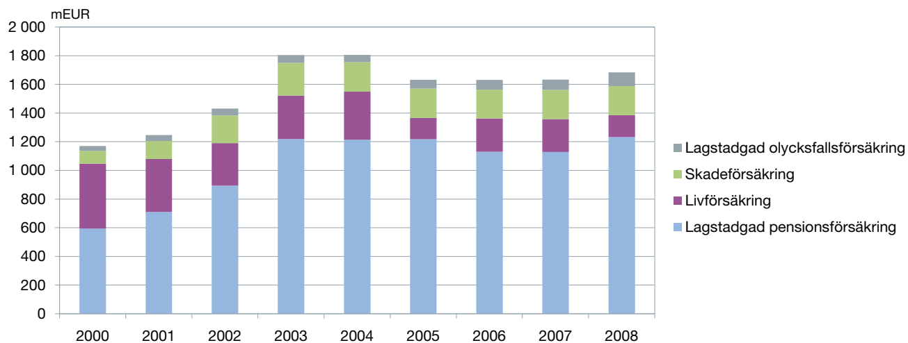
Figur 4. Till Finland och utomlands förmedlade försäkringspremier utan lagstadgade försäkringar 2000–2008