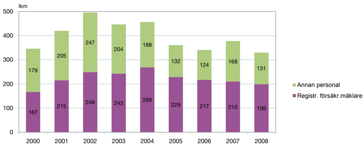
Figur 2. Försäkringsmäklarföretagens personal 2000–2008